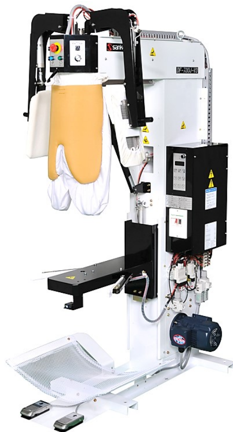
DF-730J-v3 パンツ・トッパー